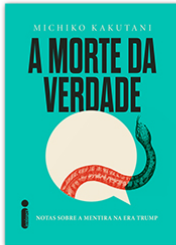
A morte da verdade Michiko Kakutani